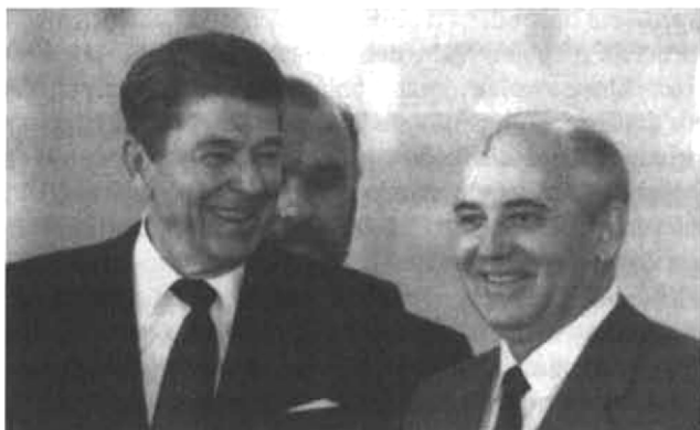
Ronald Reagan a Michail Gorbačov v Moskvě v roce 1988.

A až se to stane, bude to jen další potvrzení správnosti Reaganovy přímočaré politiky, jež odmítá ústupky. Tím se zároveň posílí naděje světa na zachování míru ve svobodě – s důrazem na oba tyto stejně důležité, posvátné pojmy.