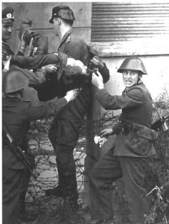
Berlín, 17. 8. 1962. Východoněmečtí vojáci odnášejí Petera Fechtera zastřeleného při pokusu o útěk přes berlínskou zeď.