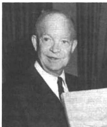
Dwight D. Eisenhower