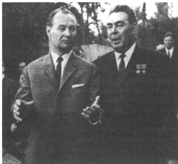
Alexander Dubček a Leonid I. Brežněv v roce 1968.

30 Lidová demokracie , 20. a 21. července 1968; srov. též The New York Times , 20. července 1968.