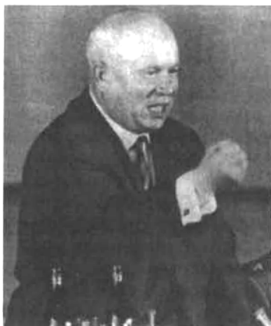
Nikita S. Chruščov