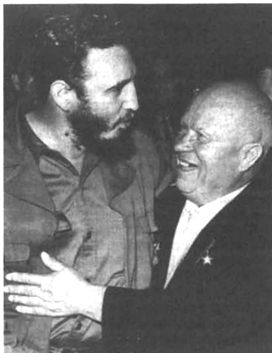
Fidel Castro a Nikita S. Chruščov v roce 1960.

(86) ní hospodářské pomoci, či ve sporadických protestech proti Castrovu režimu a pokusech s ním nějak koexistovat. Především Kubánci sami by měli být podněcováni a vyzýváni k tomu, aby podnikli rozhodné kroky proti komunistům ve vlastní vládě. Když se sami pokusí znovu získat svobodu, když se pokusí vyhnat komunisty a jejich spojence z kubánské vlády, neměla by Organizace amerických států nečinně přihlížet a měla by poskytnout pomoc demokratickým silám, které bojují nejen za svou vlastní zemi, ale za budoucnost všech svobodných národů.